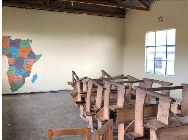
Sakala, Tanzania - Bright school Lokaal met opgeknapte muren