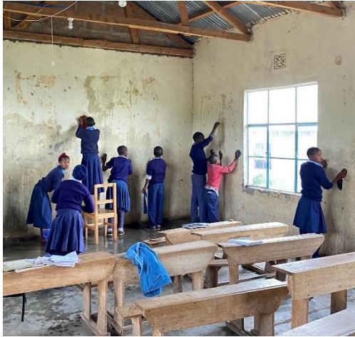
Sakala, Tanzania - Bright school Prepareren muren voorafgaand aan schilderwerk