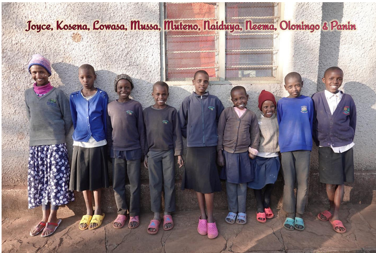
Sakala, Tanzania - november 2019

Wij en alle gesponsorde kinderen danken u voor uw ondersteuning.