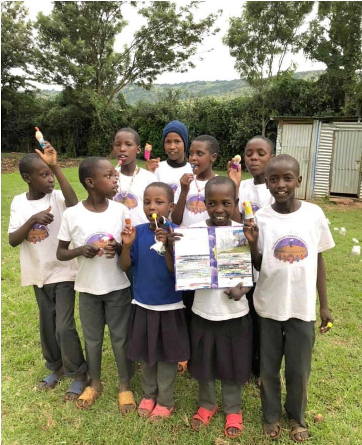
Onze gesponsorde kinderen op het terrein van de MHCf blij met het door ons gemaakte fotoalbum met foto's uit november 2019 en de in Nederland aangeschafte vingerpopjes. Alles meegebracht door de Engelsen in maart 2020.